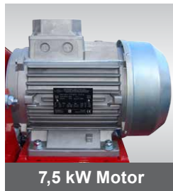
7,5 kW Motor

Lieferung erfolgt inkl. Diamanttrennscheibe.